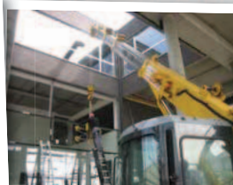
Pose de vitrages