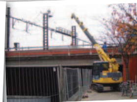
Travaux de levage variés