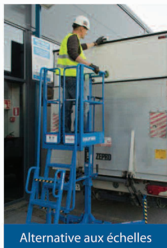
Alternative aux échelles