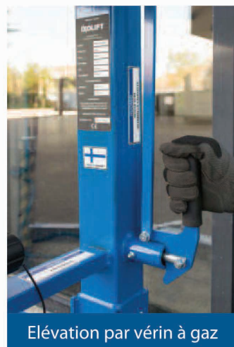
Élévation par vérin à gaz